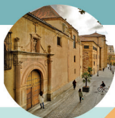
Iglesia de la Vera Cruz