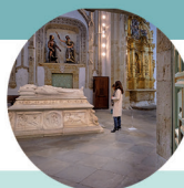
Museo Las Úrsulas